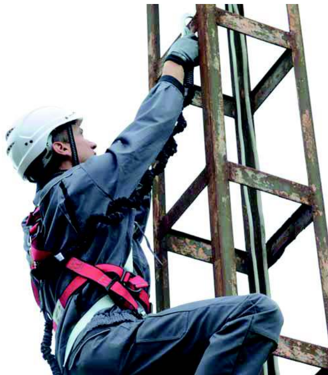
Izmantojama darbam augstumā /alpīnismam atbilstoši EN 12492 (ar zoda siksnu)